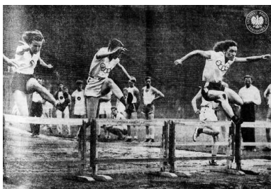
Stanisława Walasiewicz w czasie biegu przez plotki. Zdjęcie opublikowane w dzienniku „Sokół Polski. Urzędowy Organ Sokolstwa Polskiego w Ameryce”, Pittsburgh, R. XLII, z dnia 7 VII 1938 r.