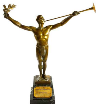
Nagroda Centralnego Instytutu