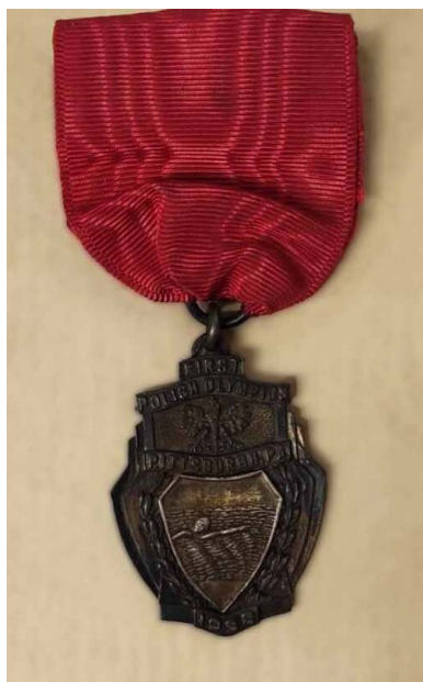
Medal w pływaniu. Pierwsza Polska Olimpiada w Pittsburghu, 1938 r. (artefakt z zespołu: Archiwum Sokolstwa Polskiego w Ameryce, przechowywanego w Archiwum IPN w Warszawie)