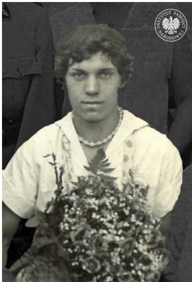
Stanisława Walasiewicz w Pierwszej Polskiej Olimpiadzie w Pittsburghu zdobyła osiem medali