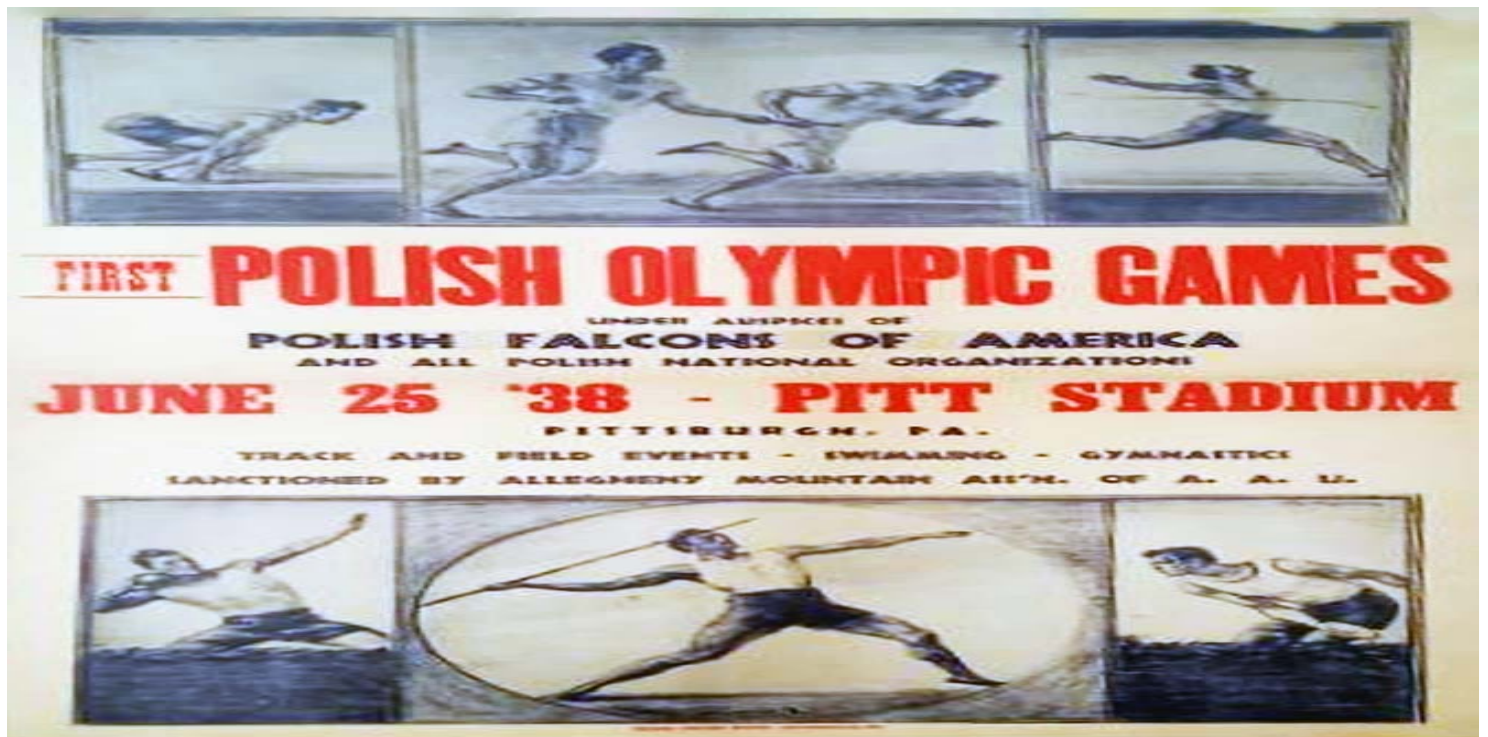
Plakat Pierwszej Polskiej Olimpiady w Pittsburghu, 1938 r. (dokument z zespołu: Archiwum Sokolstwa Polskiego w Ameryce, przechowywanego w Archiwum IPN w Warszawie)

https://przystanekhistoria.pl/pa2/tematy/emigracja/125972,Polska-olimpiada-na-amerykanskej-ziemi.html