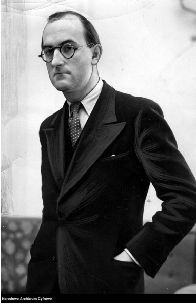
Jan Lechoń