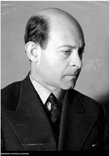
Józef Wittlin