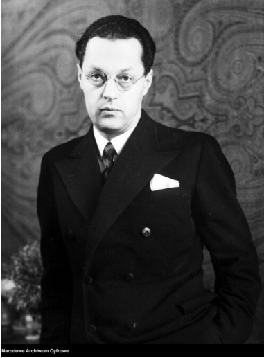
Kazimierz Wierzyński