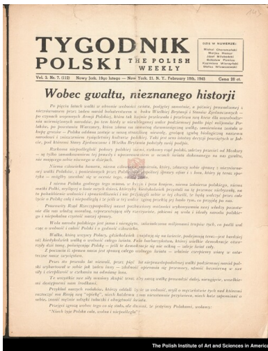
„Tygodnik Polski”