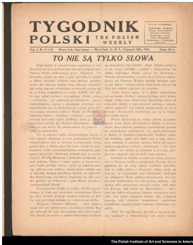
„Tygodnik Polski”