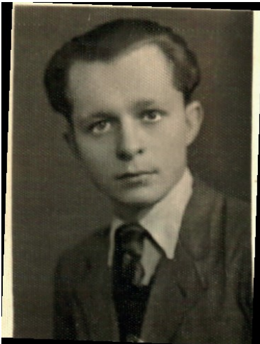
Ernest Kozubek.