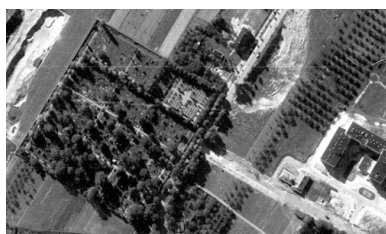
Zdjęcie lotnicze cmentarza w Wieluniu z 1956 r.