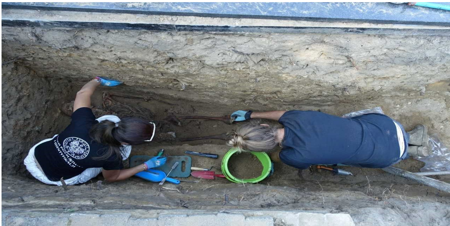
Archeolodzy z BPO IPN podczas prac ekshumacyjnych w Wieluniu, wrzesień 2018 r.

https://przystanekhistoria.pl/pa2/tematy/ekshumacje/103146,Wielunska-Laczka.html