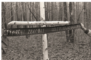
Brzozowy krzyż postawiony przez pracowników Energopolu 1 listopada 1990 r. przy dołach śmierci w Charkowie-Piatichatkach.

Jesienią 1990 r. na terenie bazy firmy Energopol w Kotelwie niedaleko Połtawy rozeszła się wiadomość o miejscach, w których mogły się znajdować zwłoki polskich oficerów. Pięćdziesięciu pracowników Energopolu zorganizowało 1 listopada 1990 r. wyprawę autobusem na tereny potencjalnej zbrodni w Charkowie.