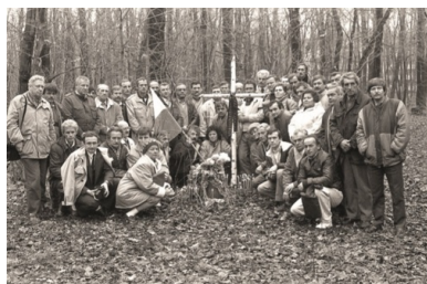
Uczestnicy wyprawy pracowników Energopolu 1 listopada 1990 r. przy dołach śmierci w Charkowie-Piatichatkach.

- jak zapamiętał pan Andrzej. Na końcu zrobiono zdjęcie pamiątkowe całej grupy. Szybko zaczęło się ściemniać, pobyt w lesie nie był więc długi. Andrzej Świdorski wspominał, że cała grupa z powrotem przeszła przez ogrodzenie, a wartownika już nie było. Polska baza Energopolu w Kotelwie była pod stałą kontrolą KGB z racji wykonywanych prac budowlanych na terenie Ukrainy należącej do ZSRS. Pracownicy Energopolu za udział w wyprawie nie spotkali się z represjami, tym bardziej że większość pracowała rotacyjnie - przyjeżdżali na kontrakt na dwanaście miesięcy i wracali do kraju.