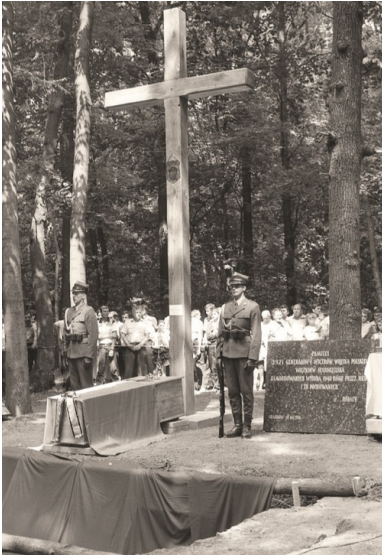
Msza św. 10 sierpnia 1991 r. wraz z pochówkiem polskich oficerów ekshumowanych w Charkowie-Piatichatkach.