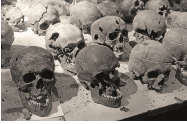
Wydobyte czaszki polskich oficerów podczas ekshumacji w Charkowie-Piaticatkach latem 1991 r.