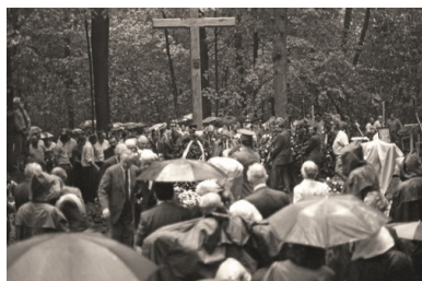
Msza św. 10 sierpnia 1991 r. wraz z pochówkiem polskich oficerów ekshumowanych w Charkowie-Piatichatkach.

„zrobiło się ciemno jak w nocy, ludzie nie wiedzieli, co się dzieje, konary fruwały. I pamiętam, jak ktoś nagle powiedział: »To tak jakby Pan Bóg zapłakał«”.