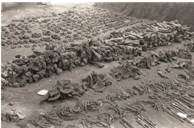
Posegregowane kości polskich oficerów podczas ekshumacji w Charkowie-Piatichatkach latem 1991 r.

O godzinie trzynastej rozpoczęła się Msza św. koncelebrowana przez kapelana wojskowego bp. Sławoja Leszka Głódzia oraz ks. Zdzisława Peszkowskiego. Byli też przedstawiciele dwóch Cerkwi: autokefalicznej i moskiewskiej oraz Kościoła protestanckiego. Na ołtarzu znajdowała się w szkatule ziemia z Katynia. Wieńce zostały przywiezione z Polski, złożyła je również ludność i władze Charkowa. Na uroczystości obecni byli też Ukraińcy, którzy mieli później uczcić pamięć swoich rodaków znalezionych podczas ekshumacji.