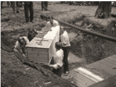
Symboliczny pochówek dziesiątej trumny ze szczątkami polskich oficerów ekshumowanych w Charkowie-Piatichatkach 10 sierpnia 1991 r.

Pracownicy Energopolu wykonali dziewięć skrzyń-trumien z krzyżem, w których umieszczono kości i czaszki polskich oficerów. Składano je do dołu śmierci i przykrywano biało-czerwoną flagą. Dziesiątą trumnę miano