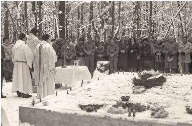
Msza św. 1 listopada 1991 r. przy grobie polskich oficerów w Charkowie-Piatichatkach.

Kilkanaście dni po pochówku pracownicy Energopolu przyjechali na miejsce ekshumacji, żeby je uporządkować i zbudować symboliczny grób. Pan Andrzej wspominał, że pierwszy raz widział płonące kwiaty i wieńce, które były już wyschnięte. W czasie wolnym (w niedziele i święta) pracownicy Energopolu wytyczyli grób, przywieźli cement i piasek, na miejscu zrobili beton. Przy krzyżu osadzono tablicę, która była poprzednio luźno umieszczona.