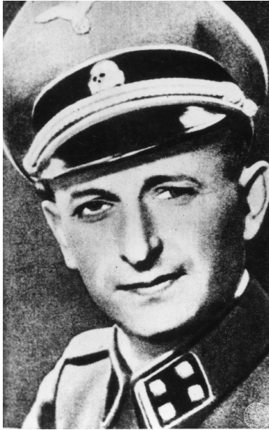
Adolf Eichmann, szef Wydziału IV (do spraw żydowskich) w Głównym Urzędzie Bezpieczeństwa Rzeszy.

Emigrację Żydów z Niemiec kontynuowano po wybuchu wojny i wspierano na terenach okupowanych przez III Rzeszę. W związku z sukcesami militarnymi Niemiec, za którymi szła okupacja coraz większej liczby krajów europejskich, pod koniec 1940 roku zaczął kształtować się pomysł „ostatecznego rozwiązania kwestii żydowskiej w niemieckiej strefie wpływów w Europie”.