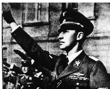
Reinhard Heydrich, szef Głównego Urzędu Bezpieczeństwa Rzeszy, jeden z architektów eksterminacji Żydów.

Jedną z form ich prześladowań były wspierane przez państwo pogromy, jak chociażby niesławna „noc kryształowa” z listopada 1938 r. Wielu Żydów zdecydowało się wówczas na emigrację, inni zostali deportowani, m.in. na tereny Polski. Władze wspierały wyjazdy Żydów z Niemiec – „eksport problemu” – i finansowały je ze środków pochodzących ze skonfiskowanych majątków żydowskich. Na początku II wojny światowej społeczność żydowska w Niemczech zmalała do ok. 214 tys.