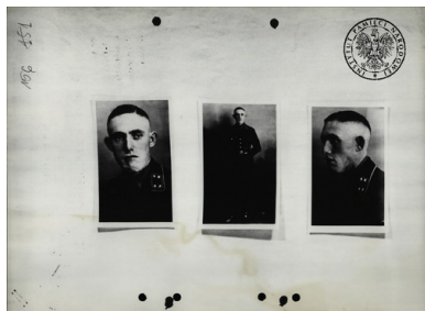
Friedrich Katzmann, dowódca SS i policji w dystrykcie Galicja, autor tzw. „raportu Katzmanna”.