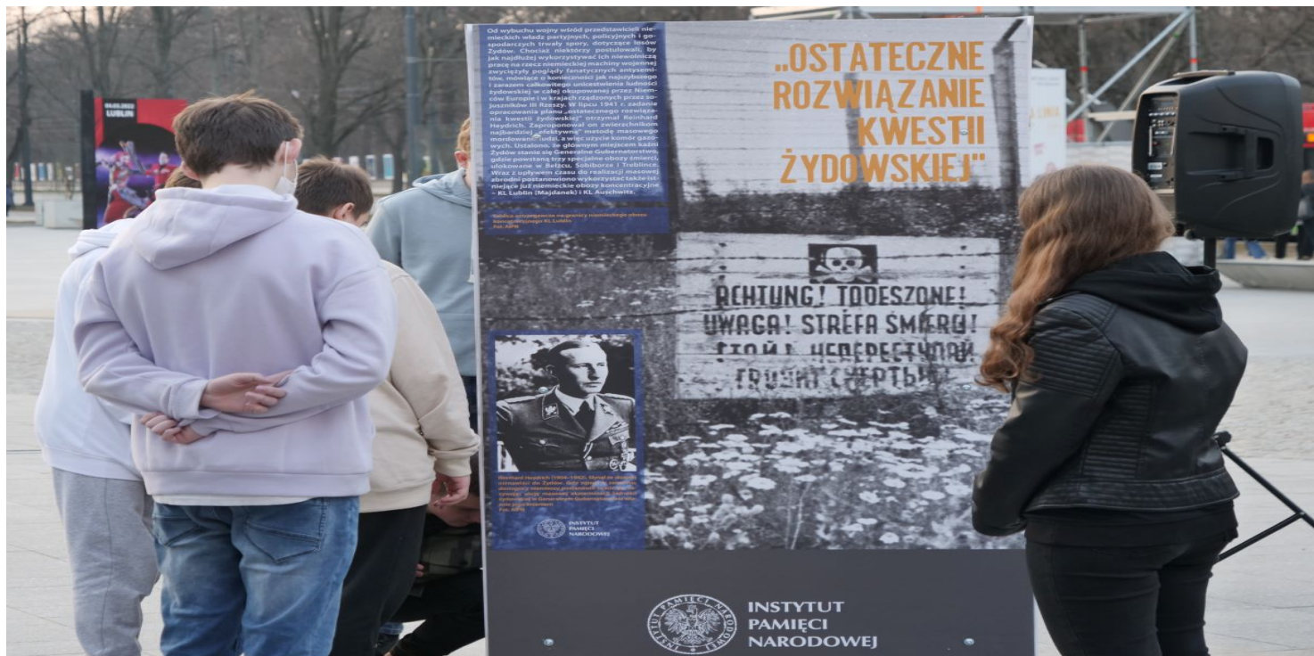
Otwarcie wystawy IPN Aktion Reinhardt 1942-1943 - Lublin, 15 marca 2022.

https://przystanekhistoria.pl/pa2/tematy/einsatz-reinhardt/99523,Poczatek-akcji-Reinhardt-niem-Einsatz-Reinhardt.html