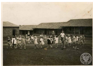
Grupa przedszkolaków z Osiedla Polskiego w Valivade.

Największym polskim obozem uchodźczym na terenie Indii było Osiedle Polskie w Valivade k. Kolhapur. Oprócz prężnie funkcjonującego harcerstwa (Hufiec Valivade), istotnym osiągnięciem była szeroka sieć szkół, których potrzeby w Delegaturze Ministerstwa Wyznań Religijnych i Oświecenia Publicznego w Bombaju reprezentował Inspektorat Szkolny pod kierownictwem Zdzisława Żerebeckiego, jednocześnie nauczyciela matematyki w valivadzkich szkołach średnich.