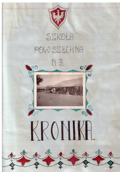
Strona tytułowa kroniki Szkoły Powszechnej nr 3 im. gen. Władysława Sikorskiego w Osiedlu Polskim w Valivade.