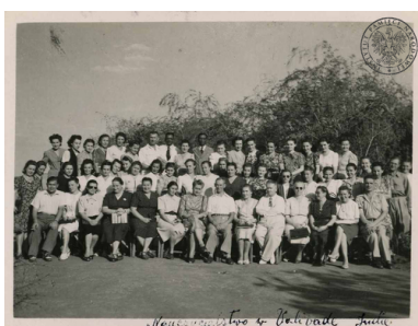
Grupa nauczycieli zatrudnionych w polskich szkołach na terenie Osiedla Polskiego w Valivade.