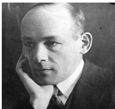
Janusz Jędrzejewicz (1885-1951), minister wyznań religijnych i oświecenia publicznego w l. 1931-1934, premier w l. 1933-1934

Ukraińcy byli najliczniejszą z mniejszości narodowych, stanowiąc ok. 15% ogółu obywateli państwa polskiego. Szkoła była fundamentem ruchu ukraińskiego i kształtowania świadomości narodowej. Dlatego też stała się tak istotną częścią sporu pomiędzy ukraińską inteligencją a polską władzą administracyjną na terenie Galicji Wschodniej oraz Wołynia.