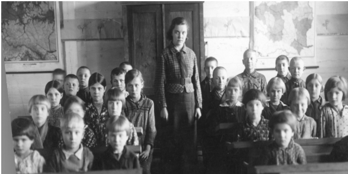
Uczniowie podczas lekcji

https://przystanekhistoria.pl/pa2/tematy/dzieci/97983,Spor-polsko-ukrainski-o-szkolnictwo-w-II-Rzeczypospolitej-Akcja-plebiscytowa-i-a.html