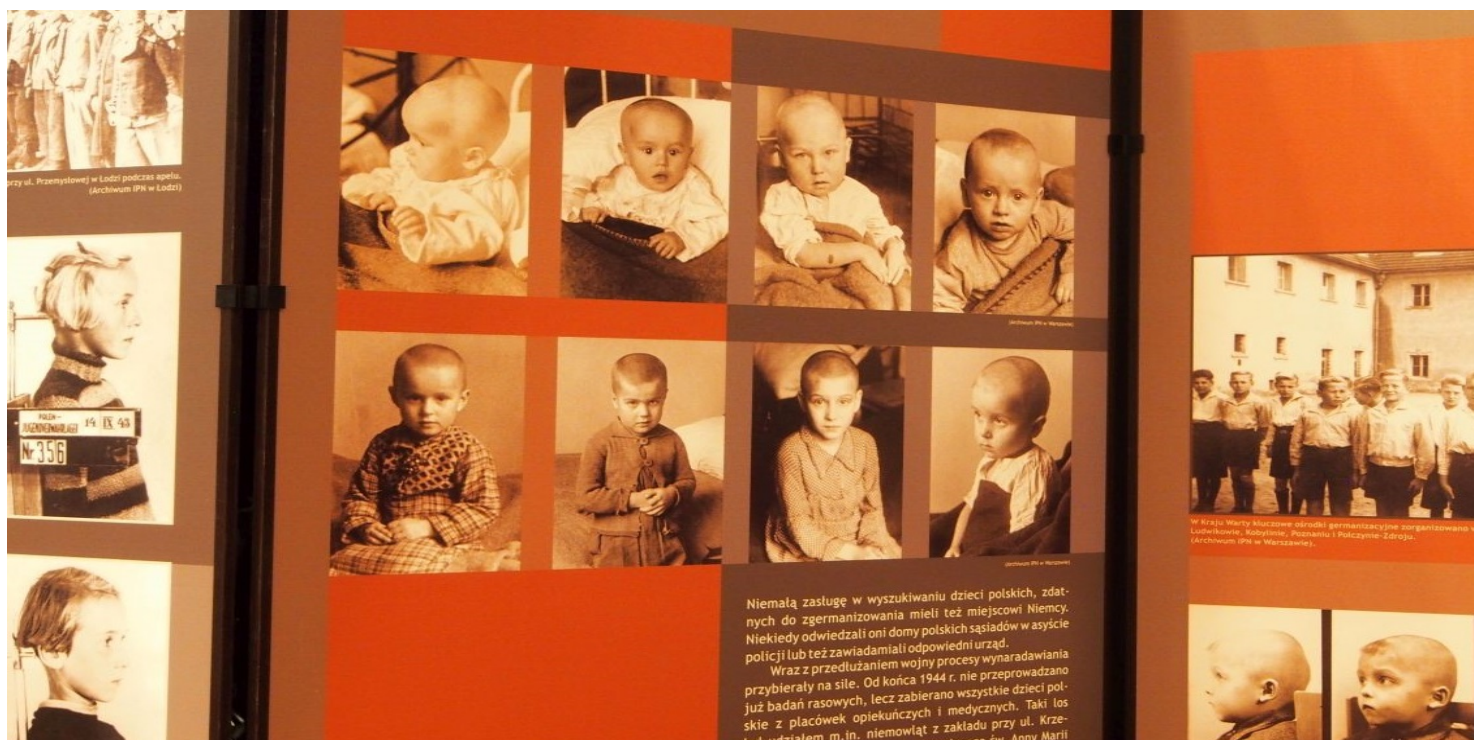
Plansza wystawy IPN pt. „Germanizacja dzieci polskich w czasie II wojny światowej”

https://przystanekhistoria.pl/pa2/tematy/dzieci/61290,Dzieci-z-Przemyslowej-niemiecki-oboz-w-Lodzi.html