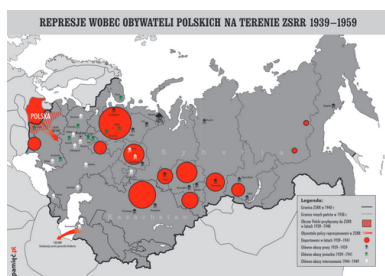
Mapa represji wobec obywateli