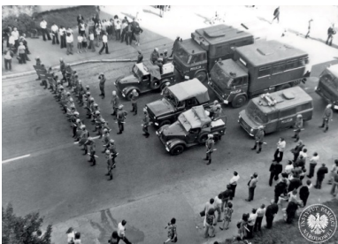
Protest robotników tłumili oddziały MO i ZOMO, ul. 1 Maja w Radomiu, czerwiec 1976 r.

No, ale widać już było, że będzie potrzebna pomoc prawna, że potrzebna będzie pomoc finansowa, czyli że trzeba zabrać się do pracy. I ja tak gdzieś w lipcu, tuż po tych rozprawach, spotkałem na ulicy Piotra Naimskiego, albo może to on mnie spotkał. W każdym razie spotkaliśmy się, no i on powiedział mi, że podejmowane są różne akcje przez harcerzy z Czarnej Jedyńki i czy może bym się w te działania chciał włączyć. Razem studiowaliśmy na uniwersytecie i stąd ta pewność z jego strony, że można ze mną otwarcie rozmawiać. Byłem pracownikiem Instytutu Badań Jądrowych. Bardzo często przeprowadzałem eksperymenty, które trwały dwa, trzy dni nawet. I potem mogłem sobie te dni odbierać. W związku z tym zaproponowałem, a może mnie zaproponowano, ażebym jeździł do Radomia, bo trzeba było na to przeznaczyć właściwie cały dzień. Wyjechać rano, przed południem i wieczorem wracać, czyli nie można było jednocześnie być zatrudnionym w takim systemie codziennym.