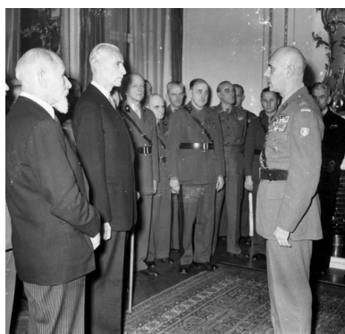
Spotkanie noworoczne u Prezydenta RP. Na pierwszym planie od lewej stoją: premier Tomasz Arciszewski, prezydent

W pojałtańskiej Polsce sukcesywnie realizowano politykę likwidacji warstw przywódczych, doprowadzając do odwrócenia drabiny społecznej. Przywódcy Państwa Polskiego, którzy w czasie II wojny światowej brali na swe barki ciężar prowadzenia prac państwowych na uchodźstwie i w konspiracji, po zajęciu Rzeczypospolitej przez Armię Czerwoną skazani zostali na zagładę lub zapomnienie. Na uchodźstwie pozostali wybitni przedstawiciele polskiego świata politycznego, a także znaczna część polskiej armii. Ich podwładni w kraju byli mordowani, więzieni, zmuszani do milczenia lub kolaboracji. Na wegetowanie na marginesie życia publicznego skazano środowiska najbardziej aktywne państwowotwórczo w II Rzeczypospolitej – ziemian, przedsiębiorców, rzemieślników, bogatsze chłopstwo... Niszczono elity intelektualne: naukowców, twórców, duchowieństwo... Dotychczasową elitę skazano na egzystencję na marginesie życia społecznego. Awansowano natomiast reprezentantów nizin społecznych. Próba zawładnięcia ludzkimi duszami musiała się wiązać z odrzuceniem narodowej tradycji i kultury, której „wsteczność” i „reakcyjność” była nie do pogodzenia z komunistyczną ideologią.