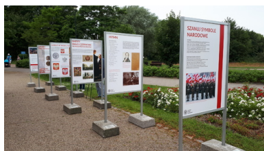
Wystawa IPN „Polskie Symbole Narodowe” - Gdańsk, 4 lipca 2020 r.

Istotne znaczenie miały poglądy polityczne badanych: 64% osób deklarujących się jako zwolennicy PiS (i innych partii Zjednoczonej Prawicy) popierało dekomunizację ulic. Przeciwni jej byli zwolennicy PO – 58% i Nowoczesnej – 55%.