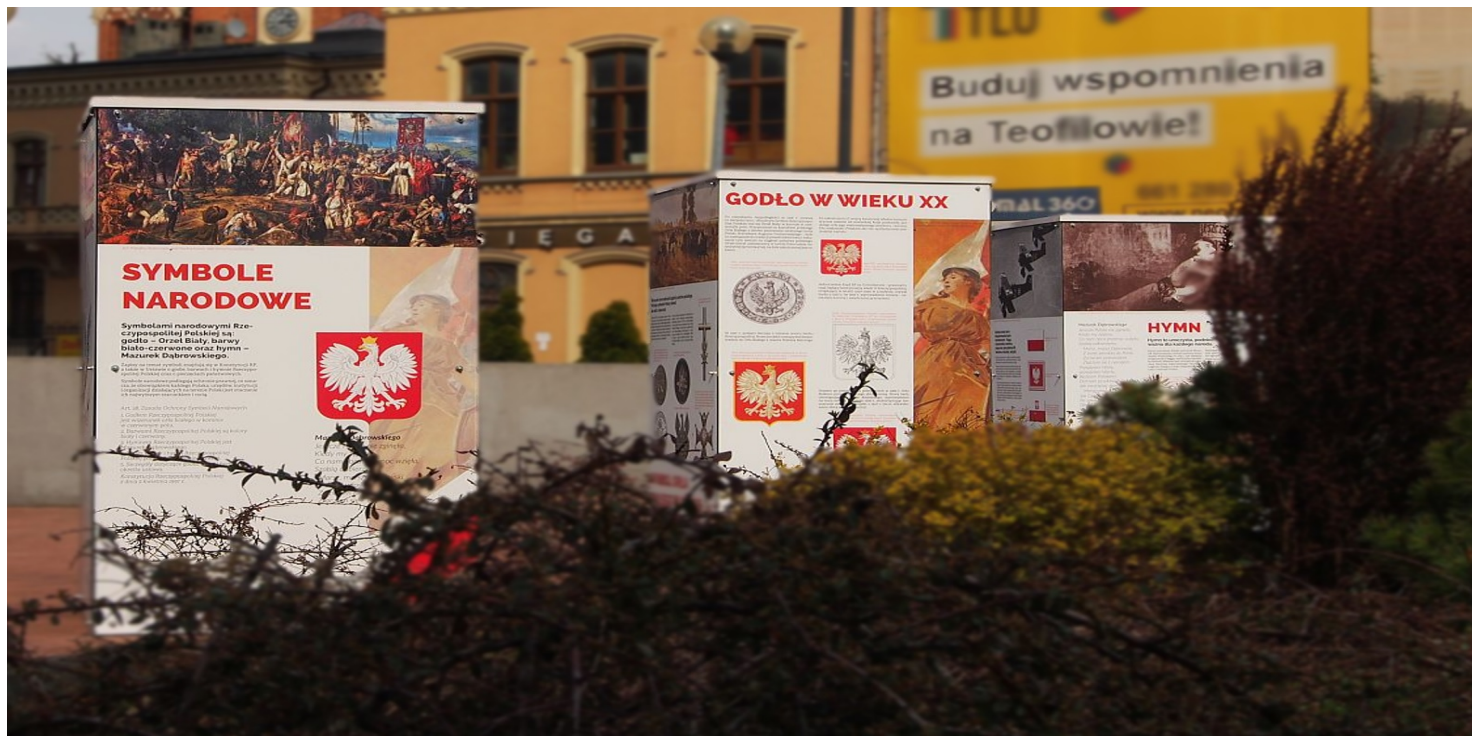
Wystawa IPN „Polskie Symbole Narodowe” - Łódź, 2021 r.

https://przystanekhistoria.pl/pa2/tematy/dekomunizacja/90254,Miedzy-symbolika-niepodleglosciowa-a-cieniem-totalitaryzmu.html