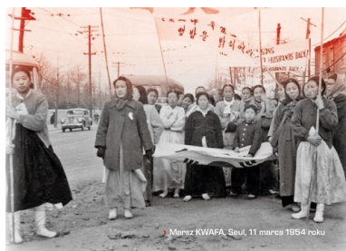
► Marsz KWAFU, Seul, 11 marca 1954 roku