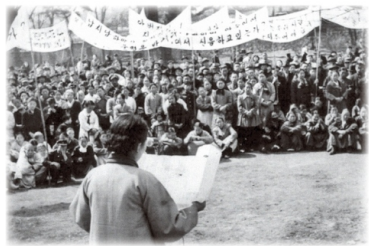
► Odczytanie petycji KWAFU do prezydenta Syngmana Rhee, 1954 rok

Korei. Jako pierwszy na jego czele stanął późniejszy prezydent Syngman Rhee – lepiej znany w Polsce jako Li Syn Man , „czarny charakter” późniejszej propagandy komunistycznej..