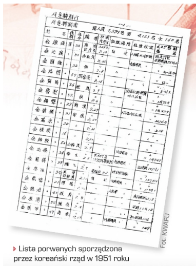
► Lista porwanych sporządzona przez koreański rząd w 1951 roku