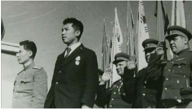
Kim z oficerami sowieckimi w 1945 roku

Dla chłopskich mas Korei, odizolowanych od świata zewnętrznego, niewykształconych, nieustannie indoktrynowanych i od bardzo wielu pokoleń wdrażanych do posłuchu wobec cesarzy posiadających „boskie” właściwości, podobne treści przekazywane przez propagandę komunistyczną były czymś znanym i naturalnym. Kult jednostki posiadającej nadnaturalne zdolności połączono w Korei Północnej z całkowitą likwidacją życia religijnego – obiektem czci stać się miał tylko komunistyczny przywódca, któremu wzorem cesarzy nadano cech paternalistyczne, nazywając go „ojcem narodu”.