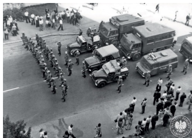
Protest robotników tłumili oddziały MO i ZOMO, ul. 1 Maja w Radomiu, czerwiec 1976 r.

Dobrowolska Chojeckiego do sądu nie pozwała i na jego słowa nie zareagowała. Dwa lata później zmarła. Nie objęło jej żadne postępowanie dyscyplinarne – już wówczas możliwe w oparciu o uchwaloną w 1998 r. ustawę o odpowiedzialności dyscyplinarnej sędziów, którzy w latach 1944–1989 sprzeniewierzyli się niezawisłości sędziowskiej. Dziennikarce „Gazety Wyborczej”, która pytała ją o procesy czerwcowe, odparła, że nie zamierza wracać do tamtej przeszłości, bo „ten temat jest już dla niej ostatecznie zamknięty”.