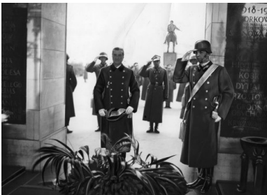
Regent Węgier Miklos Horthy podczas wizyty w Polsce składa wieniec na Grobie Nieznanego Żołnierza w Warszawie. Za nim

„Pierwotna nieokiełznana radość nad porażkami polskimi ustępuje miejsce troskom, jakie konsekwencje mieć może dalsze posuwanie się wojsk rosyjskich dla państwa czeskiego” 35 .