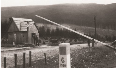
Granica z Czechosłowacją. Przejście graniczne Korbielów- Orawska Półgóra - 1925 r.