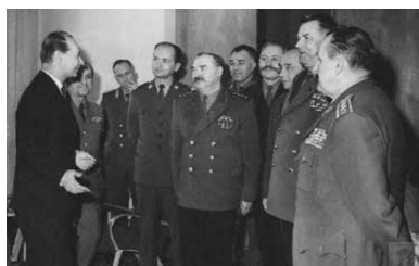
Od lewej: Aleksander Dubczek, gen. Wojciech Jaruzelski (czwarty) i marsz. Iwan Jakubowski (dziewiąty), 1 marca 1968 r.

Ćwiczenia „Szumawa” odbywały się od 18 czerwca do 2 lipca i były elementem szerszych manewrów wojsk Układu Warszawskiego przeprowadzonych na terenie południowej Polski oraz w południowej części NRD. Kierował nimi marsz. Jakubowski. Wzięły w nich udział wydzielone jednostki Armii Sowieckiej, Czechosłowackiej Armii Ludowej (ČSLA), Narodowej Armii Ludowej NRD (pozostawały na terytorium NRD), Węgierskiej Armii Ludowej oraz Wojska Polskiego. Na terytorium CSRS wprowadzono sztaby oraz wydzielone jednostki, które stacjonowały na poligonach. Oficerowie wykazywali nadzwyczajną aktywność w odwiedzaniu czechosłowackich garnizonów, zakładów pracy, a przede wszystkim w rozpoznaniu przyszłych rejonów działania. Atmosfera między oficerami czechosłowackimi i pozostałych armii była bardzo napięta. Od początku oczywisty był bowiem polityczny cel ćwiczeń – zmuszenie władz czechosłowackich do wycofania się z reform. Zgodę na wejście na terytorium tego kraju sztabu polskiej armii oraz sztabu 10. Dywizji Pancерnej wyrażono dopiero 19 czerwca, tj. w dniu rozpoczęcia ćwiczeń – po interwencji marsz. Jakubowskiego u najwyższych władz czechosłowackich.