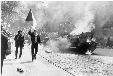
Płonący sowiecki czołg w Pradze, 1968 r.

Wynik spotkania był dla kierownictwa czechosłowackiego tak szokujący, że nie został ujawniony opinii publicznej. Od Drezna rozpoczęła się akcja wywierania nacisku na Pragę, aby zaprowadziła „w tym kraju porządek oraz zdławiła kontrrewolucję”.