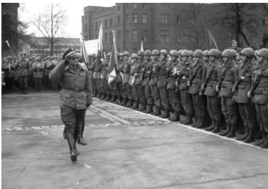
Gen. Florian Siwicki przed frontem żołnierzy wracających z CSRS, Wrocław, 4 listopada 1968 r.

Od 24 do 26 sierpnia w Moskwie trwały rozmowy między delegacją czechosłowacką, na czele której stali Svoboda i Dubczek, a sowiecką, której przewodniczyli Breżniew i premier Aleksiej Kosygin. Delegacja czechosłowacka podpisała tzw. protokół moskiewski 26 sierpnia. W zamian za przyrzeczenie pacyfikacji w kraju, uzyskano zapewnienie, że wojska interwencyjne zostaną wycofane po zlikwidowaniu zagrożenia socjalizmu w Czechosłowacji. Od tego momentu napięcie zaczęło opadać. Jednostki interwencyjne zaczęły wycofywać się z miast i skoncentrowały się na terenach leśnych i obszarach podmiejskich. Podczas wizyty delegacji czechosłowackiej w Moskwie 3 października dokonano przeglądu realizacji protokołu moskiewskiego. 16 października w Pradze podpisano układ o warunkach czasowego stacjonowania Armii Sowieckiej na terytorium Czechosłowacji.