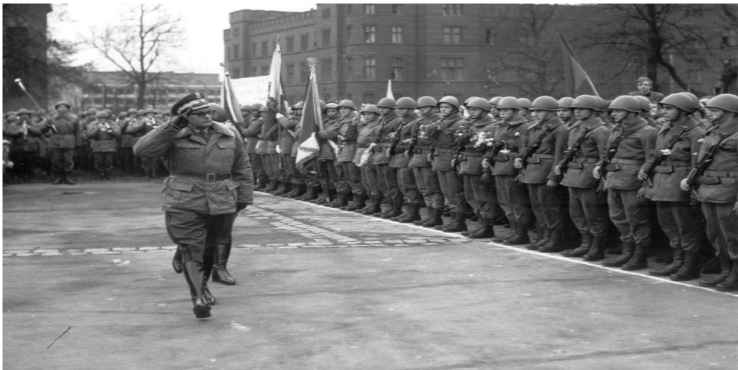
Gen. Florian Siwicki przed frontem żołnierzy wracających z CSRS, Wrocław, 4 listopada 1968 r.

https://przystanekhistoria.pl/pa2/tematy/czechoslowacja/81440,Udzial-PRL-w-inwazji-na-Czechoslowacje.html