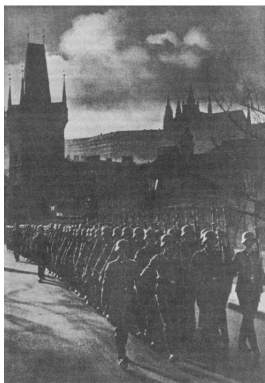
Niemiecka okupacja Czech i Moraw, wojska hitlerowskie w Pradze, 1939.

Praktycznie w całej książce nie znajdujemy odniesienia do relacji polsko-czechosłowackich w zakresie operacji specjalnych. Co wobec planowanej konfederacji polsko-czechosłowackiej oraz wspólnych planów w zakresie działalności konspiracyjnej na terenach obu okupowanych krajów – jest niezrozumiałe.