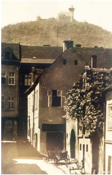
Ulica w dawnym Moście u podnóża wzgórza zamkowego, około 1890.

Jednakże dziś na próżno szukać miasta w ofertach biur podróży, katalogach czy folderach wycieczkowych. O Moście nie ma też informacji w licznie wydawanych i bogato ilustrowanych przewodnikach po Czechach. Dlaczego? Aby móc odpowiedzieć na to pytanie należy cofnąć się do epoki triumfu funkcjonalności, centralnego planowania, monumentalności świadczącej o potędze, „przyjaźni narodów”; słowem do czasów ZSRS.