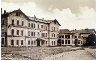
Dworzec kolejowy w starym Moście, około 1900.