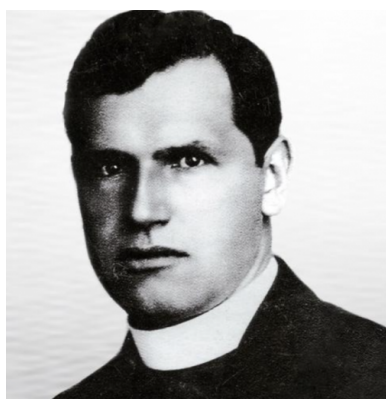
Josef Toufar (1902 - 1950)

Owego grudniowego poranka, w trzecią niedzielę Adwentu, ksiądz Toufar odprawiał codzienną mszę świętą. Wkazaniu mówił o tajemnicy obecności Boga w ludzkim życiu. Gdy wypowiedział słowa: „Tutaj, w tabernakulum, jest nasz Zbawiciel”, część wiernych zgromadzonych w świątyni zauważyła, że półmetrowy krzyż stojący na ołtarzu wyraźnie się przechylił w lewą i prawą stronę pod kątem około 45 stopni. Toufar tego nie zauważył. Po Mszy św. przyszli do niego parafianie, którzy opowiedzieli o tym, co widzieli. Początkowo proboszcz nie przywiązywał do tego większej wagi, lecz kolejne relacje ludzi, którzy widzieli poruszający się krzyż (w sumie około 20 osób) przekonały go, że w istocie to był cud.