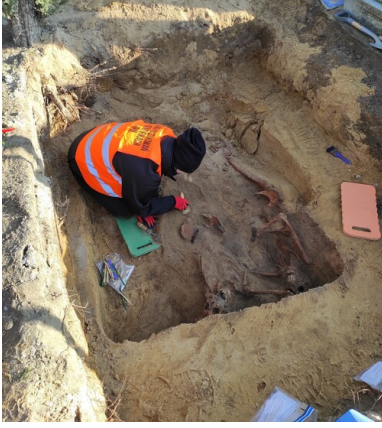
Prace ekshumacyjne w obrębie grobu wojennego, listopad 2020 r.