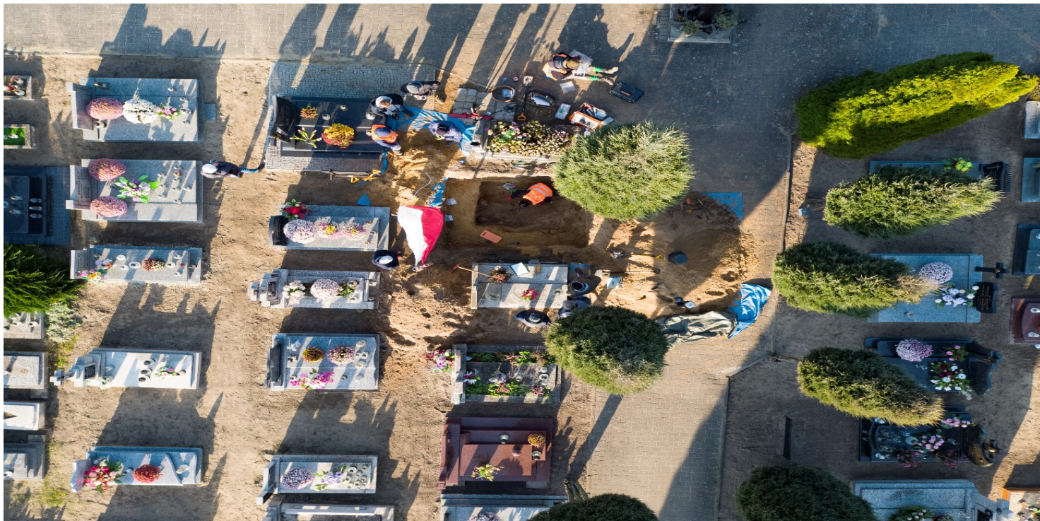
Prace w grobie wojennym na cmentarzu w Starym Ochędzynie, listopad 2020 r.

https://przystanekhistoria.pl/pa2/tematy/cmentarze/103137,Polegli-w-obronie-granicy-o-zolnierzach-Wielunskich-Batalionow-Obrony-Narodowej.html