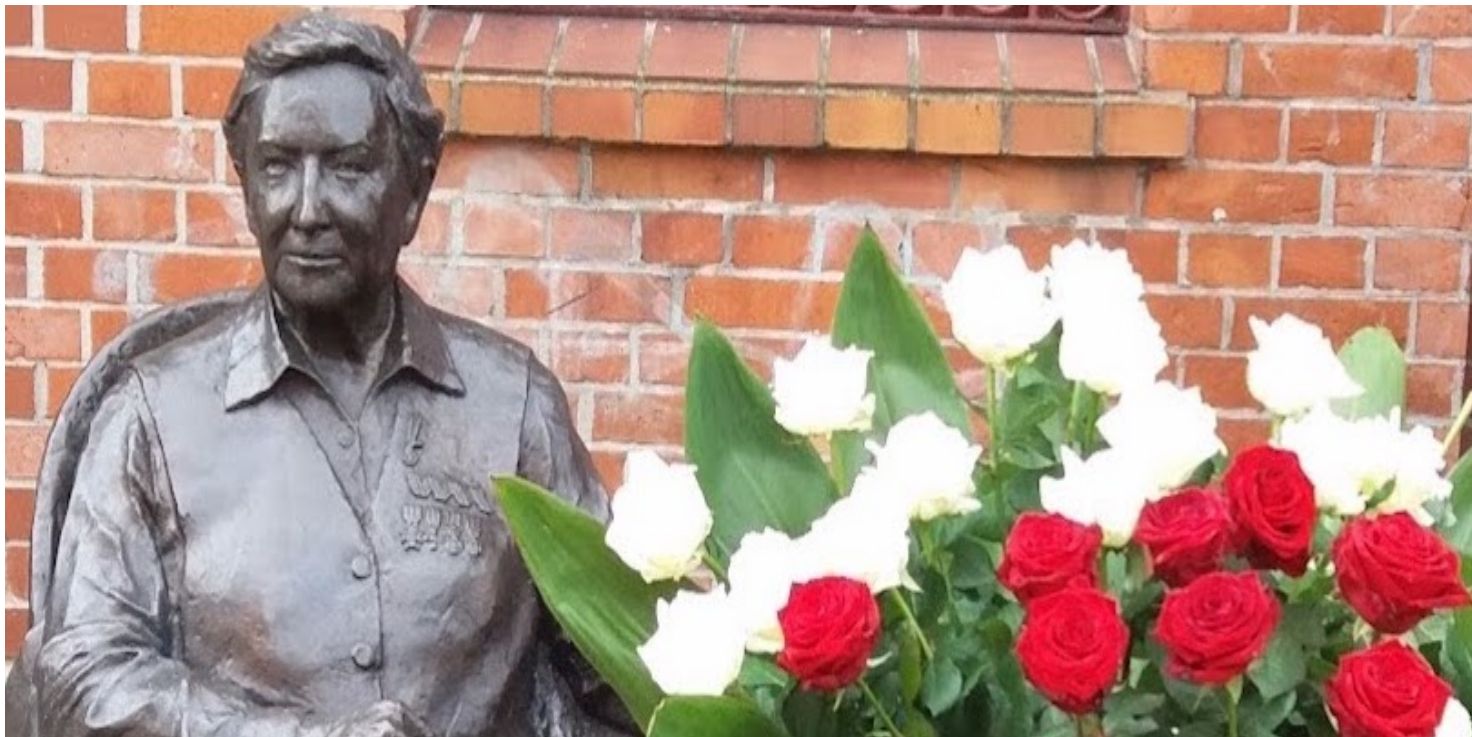
Pomnik Elżbiety Zawackiej w Toruniu

https://przystanekhistoria.pl/pa2/tematy/cichociemni/94415,Na-szkode-Panstwa-Polskiego-Emisariuszka-i-kurierka-Elzbieta-Zawacka-19092009.html