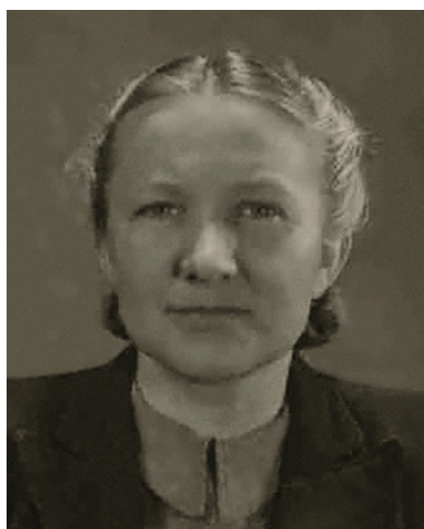
Elżbieta Zawacka jako „Elizabeth Watson”, Londyn, maj 1943 r.