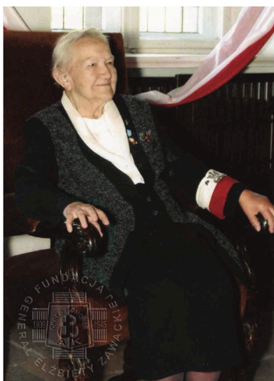
Profesor Elżbieta Zawacka awansowana przez prezydenta Lecha Kaczyńskiego do stopnia generała brygady, Toruń, 2006 r.

Elżbieta Zawacka odbywała karę kolejno w więzieniach w Fordonie, Grudziądzu oraz Bojanowie. 24 lutego 1955 r. zwolniona na mocy amnestii; powróciła do służby dla kraju.