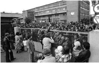
Rodziny strajkujących górników przy ogrodzeniu kopalni „Manifest Lipcowy”, Jastrzębie Zdrój, wrzesień 1980 r. Fot. Stanisław Jakubowski/PAP (za: „Biuletyn IPN”, nr 7-8/2020)

Komuniści próbowali poddać pismo rozmaitej kontroli, w tym oficjalnej cenzurze. Już w listopadzie 1980 r. analizą treści biuletynu zajął się specjalny zespół złożony z przedstawicieli Komitetu Wojewódzkiego partii, Komendy Wojewódzkiej MO, katowickiej Delegatury Głównego Urzędu Kontroli Prasy Publikacji i Widowisk oraz prokuratury. Wyniki prac zespołu zaprezentowano w grudniu 1980 r. na posiedzeniu sekretariatu KW PZPR w Katowicach. Według tych ustaleń biuletyn cechował