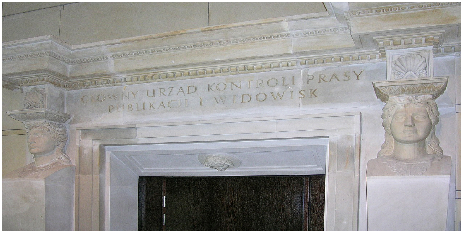
Portal ze zburzonej siedziby Głównego Urzędu Kontroli Prasy, Publikacji i Widowisk wyeksponowany w holu biurowca Liberty Corner przy ul. Mysiej 5 w Warszawie

https://przystanekhistoria.pl/pa2/tematy/cenzura/101598,Cenzura-jako-narzedzie-sprawowania-wladzy-w-PRL.html