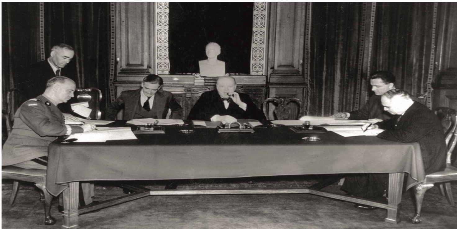
Podpisanie układu o nawiązaniu stosunków między Rzeczpospolitą Polską i ZSRS, od lewej: gen. Władysław Sikorski, N.N., Anthony Eden, Winston Churchill, NN, Iwan Majski; Londyn, 30 lipca 1941 r.

https://przystanekhistoria.pl/pa2/tematy/bliski-wschod/99600,Z-domu-niewoli-do-Iranu.html