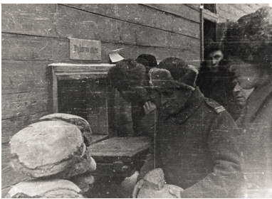
Wydawanie chleba żołnierzom w jednym z obozów Armii Polskiej w ZSRS, 1941 lub 1942 r.

Stalin nie przekazał brytyjskiemu przywódcy, że działa z inspiracji gen. Andersa. Jednak w świetle dostępnych dokumentów nie ulega to żadnej wątpliwości. Pominięcie to sprawiało jednak wrażenie, jakby Sowieci próbowali „dogadywać się” z Brytyjczykami w sprawie wojsk polskich bez udziału czynników polskich.