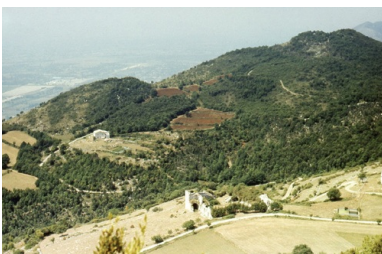
Ruiny Mass Albanety widziane ze wzgórza 593, w głębi dolina rzeki Liri, sierpień 1981 r.

W takiej sytuacji gen. Anders w porozumieniu z dowódcą armii rozkazał wstrzymać natarcie, gdyż najważniejszy cel operacji został osiągnięty. 2. Korpus Polski w pierwszym dniu natarcia zdeorientował Niemców co do głównego kierunku działania sił alianckich i związał walką ok. 9 batalionów wroga, dzięki czemu Brytyjczycy mieli przeciw sobie tylko 5 batalionów i mogli uzyskać znaczące powodzenie w ataku w kierunku doliny Liri.