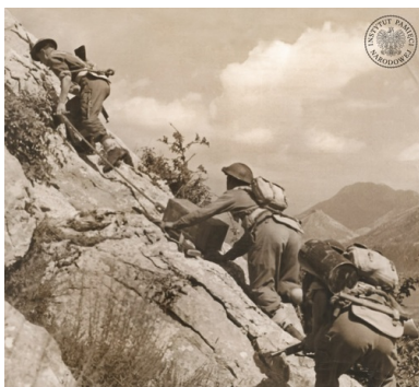
Żołnierze 2 Korpusu Polskiego zaopatrują walczące oddziały wspinając się na szczyt z pakunkami, Monte Cassino, maj 1944 r.