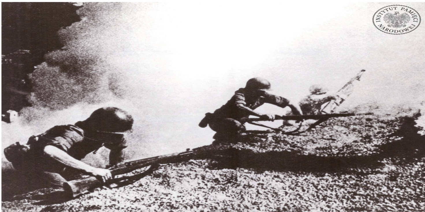
Żołnierze amerykańscy z 5 Armii Stanów Zjednoczonych w czasie walk o Monte Cassino, styczeń 1944 r.

https://przystanekhistoria.pl/pa2/tematy/bitwa-o-monte-cassino/125443,Cztery-bitwy-jedna-zwycieska.html