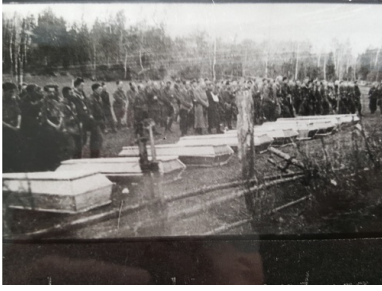
Pogrzeb poległych w bitwie o Murowaną Oszmiankę partyzantów 3. Brygady