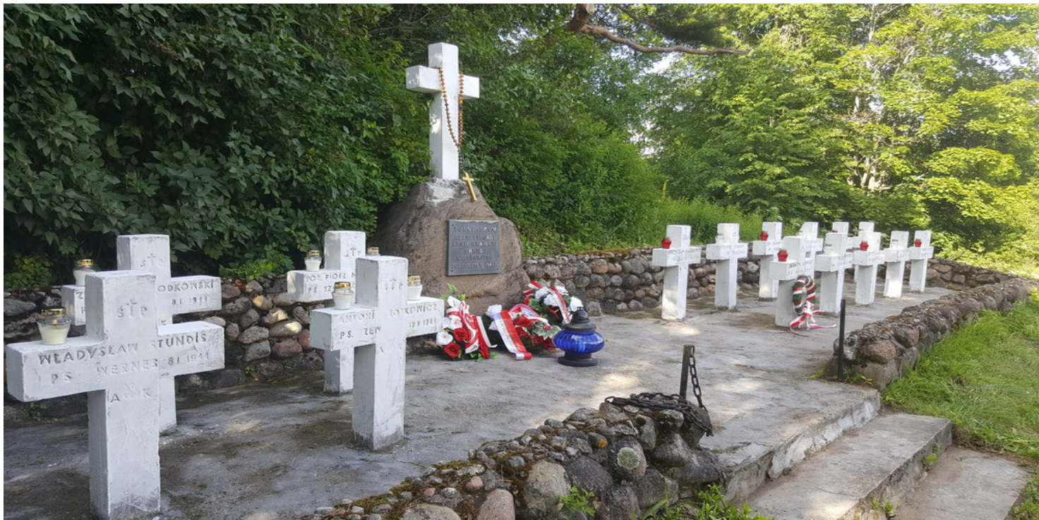
Kwatera żołnierzy III i VI Brygady Armii Krajowej Okręgu Wileńskiego w Mikuliszkach, 2017 r.

https://przystanekhistoria.pl/pa2/tematy/bialorus/94361,O-cmentarzu-zniszczonym-przez-dyktatora-Historia-partyzanckich-mogil-w-Mikuliszkach.html