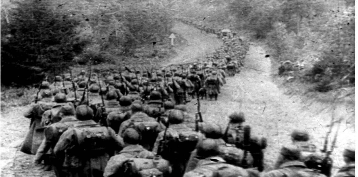
Oddziały sowieckie wkraczające do Polski 17 września 1939 r.

https://przystanekhistoria.pl/pa2/tematy/bialorus/87515,Kwestia-polska-na-sowieckiej-Bialorusi.html