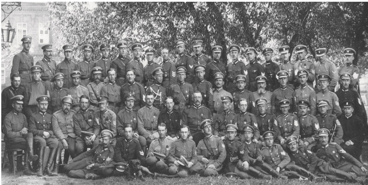
Oficerowie kawalerii I Korpusu Polskiego, wiosna 1918 r.

https://przystanekhistoria.pl/pa2/tematy/bialorus/86359,Dowboria-kresowa-epopeja-I-Korpusu-Polskiego.html