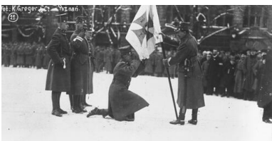
Uroczystość zaprzysiężenia wojsk powstańczych i wręczenie sztandaru 1 Dywizji Strzelców Wielkopolskich. Gen. Józef