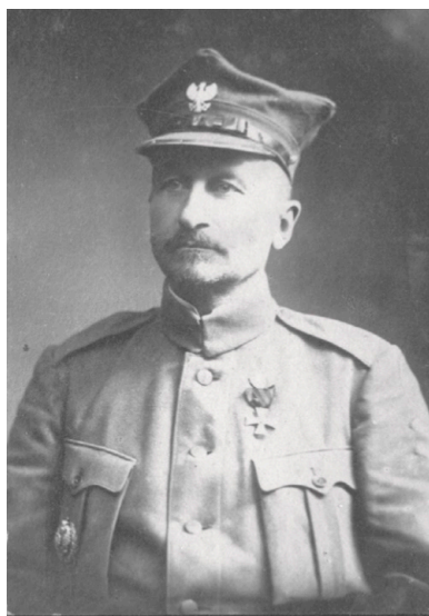
Gen. Józef Dowbor-Muśnicki - dowódca I Korpusu Polskiego w 1918 r.