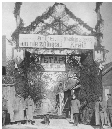
Jedna z bram wzniesionych w Bobrujsku z okazji święta 3 Maja w 1918 r.

Innym, w tym wypadku na poły konspiracyjnym wydawnictwem, które ukazywało się przy I Korpusie Polskim, było „Sumienie”. Pismo to, wydawane przez grupę piłsudczyków związanych z konspiracyjny „Związkiem Broni” i POW, redagowane przez Melchiora Wańkowicza, zaczęło się ukazywać na początku kwietnia 1918 r. Oficjalnie była to inicjatywa grupy oficerów I Korpusu, mająca charakter patriotyczny i apolityczny. Główny cel wydawnictwa stanowiło było jednak krytykowanie działań gen. Dowbora-Muśnickiego i podważanie wśród żołnierzy i oficerów zaufania do jego poczynań. Wyszły, jak się wydaje, jedynie dwa numery, w dość dużej jak na tego rodzaju wydawnictwo objętości 32 stron i w formacie broszury. Nie wiadomo, dlaczego nie ukazały się kolejne numery pisma.