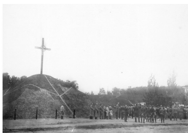
Poświęcenie kopca ku czci poległych żołnierzy I Korpusu Polskiego, 1918 r.

Nadszedł maj 1918 r. – w Bobrujsku odbywały się uroczyste obchody święta 3 Maja, będące pokazem siły i triumfu I Korpusu Polskiego. Podobne obchody zorganizowano także w innych miejscowościach, np. w Nowym Bychowie i Mohylewie. Małe państwko trwało już trzy miesiące. Ulicami miast kresowych defilowały tysiące żołnierzy i ułanów, paradowała artyleria i wozy pancerne, a na niebie przeleciały nawet polskie samoloty.