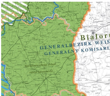
Fragment mapy ściennej „Polska 1939-1945 - podziały administracyjne” (wyd. IPN, 2013)