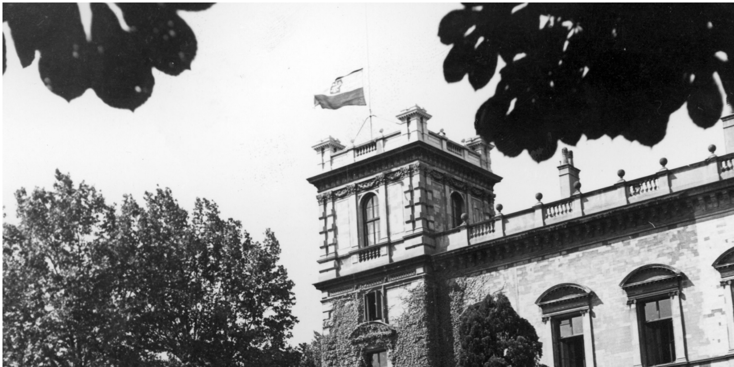
Polska flaga na gmachu siedziby Rządu RP na Uchodźstwie (Pałac Rothschildów), 1943 r.

https://przystanekhistoria.pl/pa2/tematy/august-zaleski/96475,Wobec-sowieckiego-zaboru-Polska-w-Londynie.html