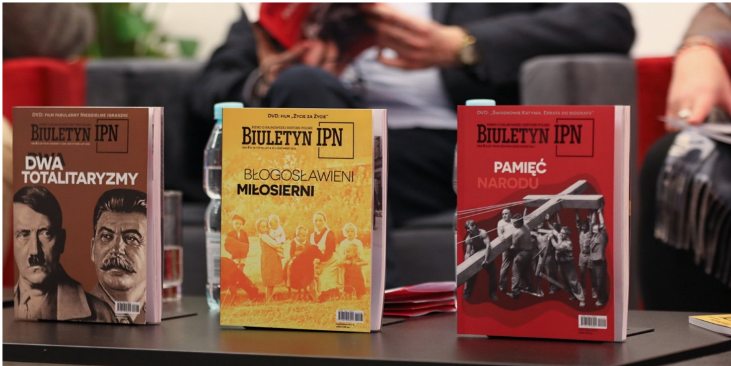
Spotkanie z „Biuletynem IPN” podczas Kongresu Pamięci Narodowej – Warszawa, 14 kwietnia 2023.

https://przystanekhistoria.pl/pa2/tematy/atak-iii-rzeszy-na-zsrs/126131,Zycie-i-smierc-w-getcie-bialostockim-19411943.html