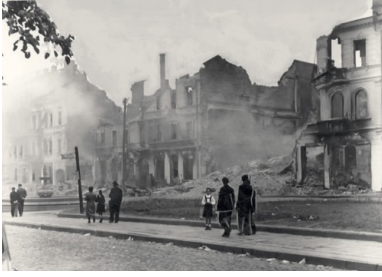
Ruiny białostockiej ulicy, lipiec 1941 r.