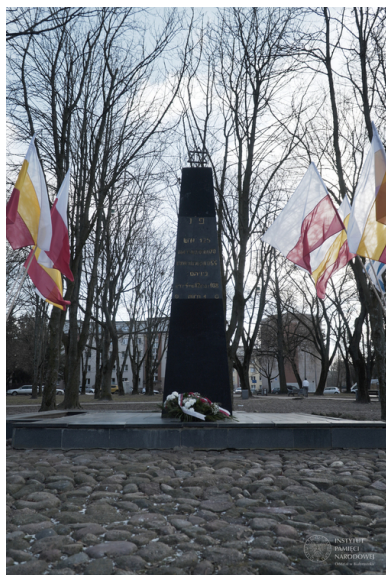
80. rocznica pierwszej niemieckiej akcji likwidacyjnej w białostockim getcie - Białystok, 5 lutego 2023 r.

W krótkim czasie na wyznaczonym przez Niemców miejscu zgromadziło się od 25–30 tys. ludzi. Gęsty tłum wypełnił ul. Jurowiecką i sąsiadujące z nią uliczki Fabryczną, Ciepłą i Kupiecką. Niemieckie działania zaskoczyły konspirację żydowską. Formułowane wcześniej pomysły o stawieniu oporu w murowanych budynkach czy fabrykach nie mogły zostać zrealizowane. Powstały ad hoc rankiem 16 sierpnia 1943 r. plan działań bojowców zakładał, że dokonają oni wyłomu w północnej części parkanu getta i wezwą zgromadzonych Żydów do masowej ucieczki. Mniemano, że dzięki temu przynajmniej niektórzy ocaleją. Takie myślenie było czystą iluzją. W jaki sposób zaskoczeni i nieuzbrojeni ludzie mieliby walczyć z Niemcami? Dlaczego mieliby posłuchać wzywających do ucieczki bojowców? Przecież coś takiego oznaczałoby niemal pewną śmierć. Alternatywą była złudna nadzieja, że Niemcy faktycznie wywiozą zgromadzonych do Lublina, gdzie Żydzi dalej będą pracować.