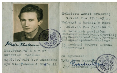
Akowska legitymacja Tadeusza Różewicza.