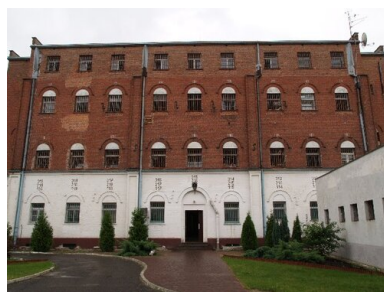
Więzienie w Goleniowie przy ul. Grenadierów 66.