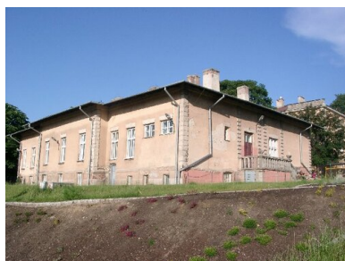
Dawna siedziba Powiatowego i Miejskiego Urzędów Bezpieczeństwa Publicznego w Kielcach przy ul. Kapitulnej 2.