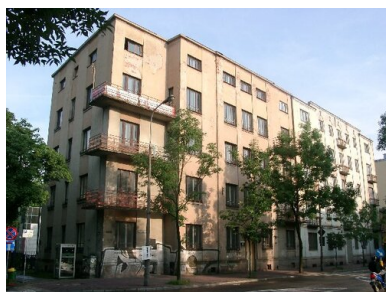
Dawna siedziba WUBP w Kielcach przy ul. Paderewskiego 10/12.