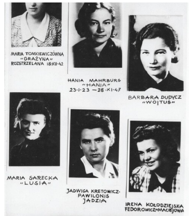
Portrety dziewcząt z grupy łączności „Kozy”