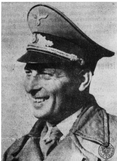
Ludobójca. Franz Kutschera.

Cel akcji na Kutschere został osiągnięty: w połowie lutego 1944 r. skończyły się uliczne egzekucje w Warszawie. Strzały, które zabiły dowódcę SS i policji, ugodziły nie tylko jego.