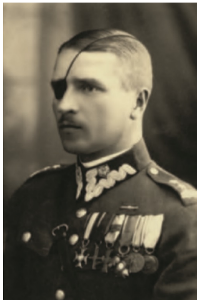
Płk. Przemysław Nakoniecznikoff „Kruk 2”, zdjęcie przedwojenne.

W podobnym duchu co rozkazy płk. „Kruka 2” był sformułowany rozkaz Komendanta Głównego AK gen. bryg. cc Leopolda Okulickiego „Niedźwiadka” z 19 stycznia 1945 r., rozwiązujący całą Armię Krajową.