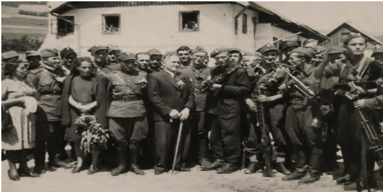
Oddział Samoobrony AK „Łazika” podczas ujawnienia w lipcu 1945 r.

https://przystanekhistoria.pl/pa2/tematy/armia-krajowa/70344,W-akcie-samoobrony-Aktywizacja-podziemia-niepodleglosciowego-w-Malopolsce-wiosna.html