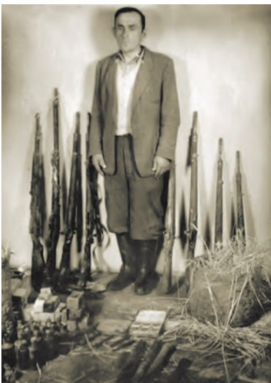
„Wróg ludu” i jedna z odnalezionych przez UB skrytek dokumentów i broni Inspektoratu AK Miechów.

I tak na przykład komórki legalizacyjne miały przygotowywać dokumenty pozwalające na bezpieczne wyjazdy zagrożonych aresztowaniem AK-owców na inny teren; niszczone miały być listy poborowych. Wskazywano też na konieczność zabezpieczenia broni, wystrzegania się używania nazwy rozwiązanej formalnie AK, podkreślano znaczenie przekazywanej z ust do ust propagandy antykomunistycznej.