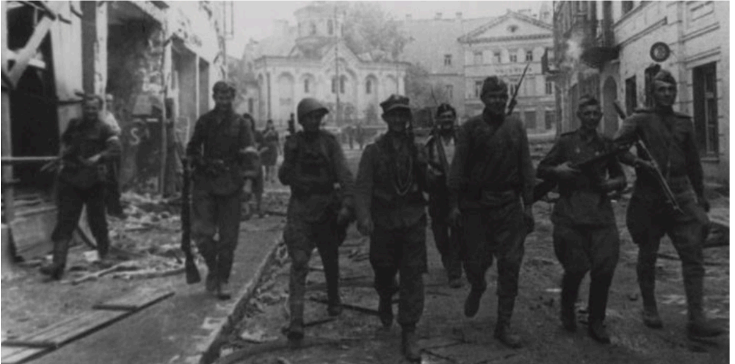
Operacja „Ostra Brama”. Polsko-sowiecki patrol na ulicy Wielkiej w Wilnie, lipiec 1944 r.

https://przystanekhistoria.pl/pa2/tematy/armia-krajowa/102501,Burza.html