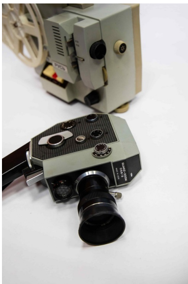
3c Kamera Quarz-Zoom 8 mm DS8-3 i projektor 8 mm PYCb -

Poza urządzeniami używanymi przez profesjonalistów do rejestracji obrazu (a z czasem obrazu i dźwięku) na taśmie filmowej produkowany był również sprzęt amatorski do bardziej powszechnego użytku. Produkty skierowane do prywatnych odbiorców dość powszechnie stosowane były jeszcze w latach osiemdziesiątych. Za pomocą kamery naświetlano podwójną taśmę, a następnie wywoływano ją i przecinano wzdłuż na pół. Po tych zabiegach filmy można było odtwarzać na przystosowanych do nich rzutnikach.