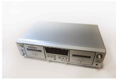
2e Magnetofon Sony TC-WE475