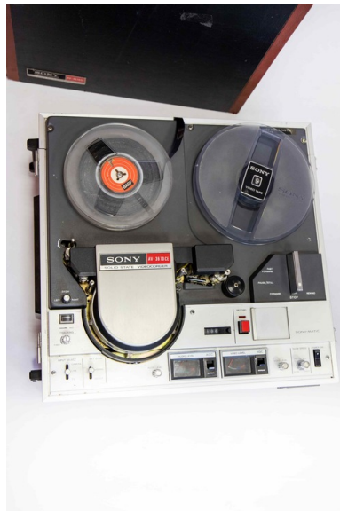
4d Magnetowid Sony AV-3670CE