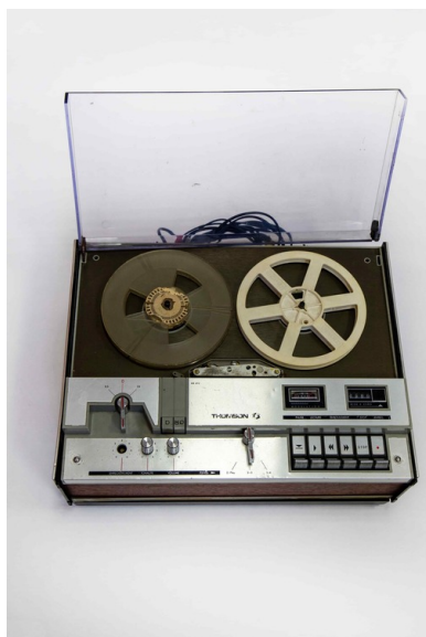
1b Magnetofon ZK 125 i ZK 140T