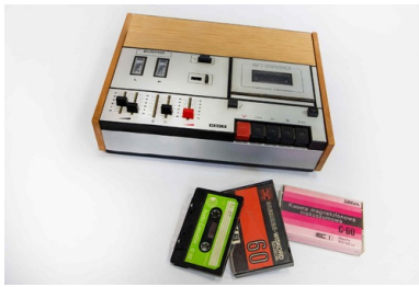
2b Magnetofon Unitra M531S i kasety