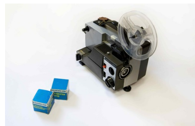
3e Projektor Sankyo dualux-2000H