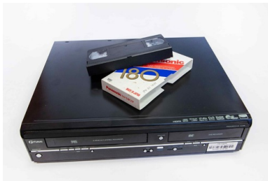
4b Magnetowid VHS-DVD Funai WD6D-D4413DB z kasetą VHS

Taśmę z zapisanym obrazem również z czasem dla ochrony umieszczono w kasecie. Kasety miały różne kształty, a zapis dokonywany był w różnych formatach na taśmach magnetycznych. Urządzenia do odtwarzania kaset podlegały miniaturyzacji i z tego powodu w latach osiemdziesiątych na rynku królował format VHS, wyparty dopiero w latach dziewięćdziesiątych przez płyty DVD. Niejako obok VHS nadal jednak używano innych formatów – jak np. Sony V-60H, Sanyo VT-30C, VCR Equipex 8 mm.