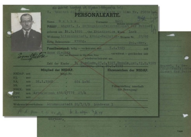
Karta ewidencyjna strażnika zatrudnionego w obozie.