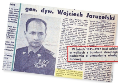
Z teści Jaruzelskiego ususzono informacje, które w czasach PRL powielano publicznie w milionach egzemplarzy, na zdjęciu „Żołnierz Wolności” z kwietnia 1989 roku

Równie ważna jak moment przerabiania dokumentu jest treść kolejnych poprawek. Otóż z innych źródeł wiadomo, że Jaruzelski na Syberii półtora roku pracował przy wyrębie drzewa w tajdze, a potem przez pół roku w przedsiębiorstwie handlowym. Ale w wyciągu z akt Jaruzelski skreślił tę drugą informację. To koresponduje z zamazaniami dokonanymi czarnym pisakiem w dokumencie z 1955 roku. Ekspertyza zamazanego tekstu przeprowadzona w lutym 2014 roku pozwoliła na jego odczytanie: tu też zamazano pracę w handlu.