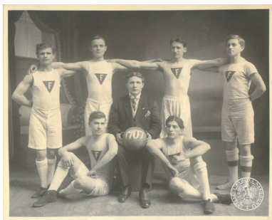
Drużyna koszykarska z sokolego gniazda nr 2 w Chicago, 1907 r.