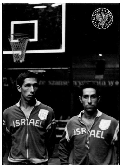
Zawodnicy reprezentacji Izraela w koszykówce podczas Mistrzostw Europy w Koszykówce w 1963 r.