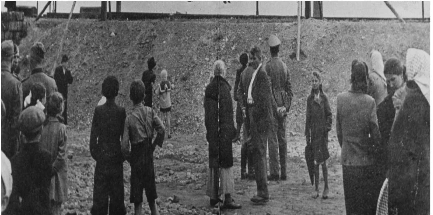
Fot. ze zbiorów AIPN

https://przystanekhistoria.pl/pa2/tematy/archiwum-ipn/101740,Fotografie-spod-szafotu.html