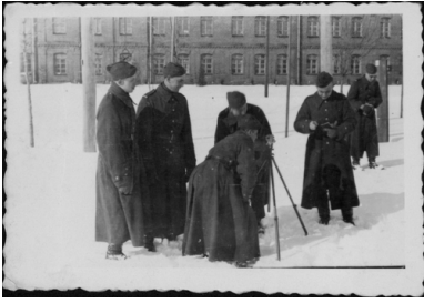
ajęcia z topografii wojskowej, 16 lutego 1938 r.