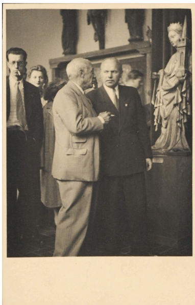
Uczestnicy Światowego Kongresu Intelektualistów w Obronie Pokoju we Wrocławiu zwiedzający Galerię Sztuki Średniowiecznej w warszawskim Muzeum Narodowym. Na pierwszym planie Pablo Picasso (po lewej) rozmawia ze Stanisławem Lorentzem. 29 sierpnia 1948 r.