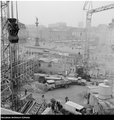
Odbudowa Zamku Królewskiego w Warszawie, w tle plac Zamkowy z kolumną Zygmunta. 16 lutego 1973 r.

Po wojnie Lorentz wykonał tytaniczną pracę wyszukiwania i sprowadzania wywiezionych elementów dziedzictwa narodowego z powrotem do stolicy. W latach 1945–1951 stał na czele utworzonej przez siebie instytucji – Naczelnej Dyrekcji Muzeów i Ochrony Zabytków. Przez wiele lat był zaangażowany w prace nad rekonstrukcją i wyposażeniem zniszczonych zabytkowych budowli, m.in. warszawskiej Starówki. To w dużej mierze dzięki jego zabiegom na rzecz uzyskania poparcia społecznego i odpowiednich funduszy oraz zgody władz odbudowany został Zamek Królewski w Warszawie (zgoda ta ostatecznie została wydana dopiero w 1971 r.). Odtworzenie tak pieczołowicie jego wystroju było możliwe dzięki zgromadzonej dokumentacji oraz elementom wystroju ocalonym przez muzealników w czasie wojny.