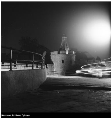
Stare Miasto nocą - 1975 r.

Marzeniem prof. Zachwatowicza była odbudowa dawnej Warszawy, co było możliwe dzięki zachowaniu dokumentacji. Mimo znacznego zmniejszenia proponowanego przez Zachwatowicza obszaru odbudowy, to dzięki jego determinacji udało się odtworzyć znaczną część Starego Miasta i Traktu Królewskiego.