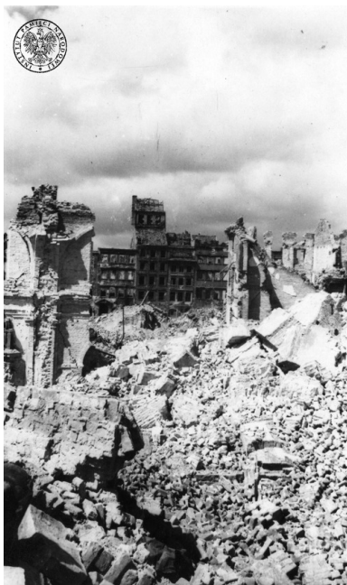
Ruiny Starego Miasta - fragment rynku, na pierwszym planie ruiny katedry św. Jana - 1945 r.