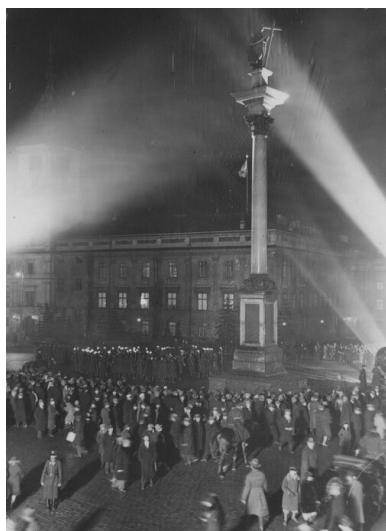
Warszawa, obchody 100. rocznicy wybuchu Powstania Listopadowego. Capstrzyk pod Zamkiem Królewskim 29 listopada 1930 r.