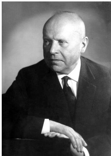
Stanisław Lorentz, profesor, historyk sztuki.