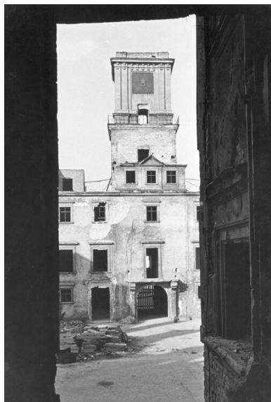
Warszawa, 1939. Zniszczony Zamek Królewski; fragment dziedzińca i wieża.