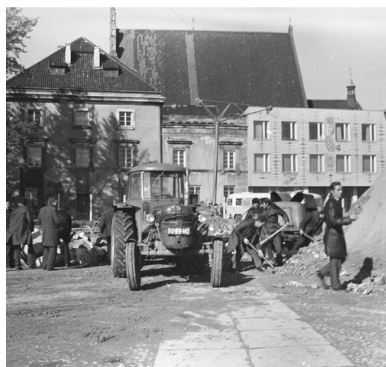
Odbudowa Zamku Królewskiego w Warszawie, październik 1971. W oddali dach katedry św. Jana Chrzciciela.