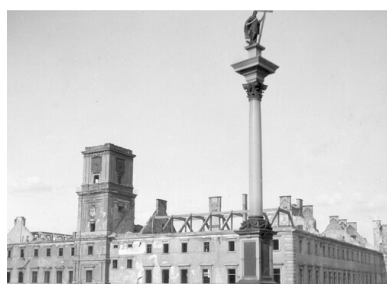
Warszawa, 1939. Zniszczony Zamek Królewski, widoczna także Kolumna Zygmunta na Placu Zamkowym.

Mógłby jednak uczynić to sam pomysłodawca.