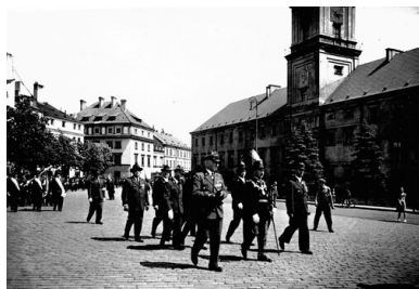
525. rocznica powstania Warszawskiego Bractwa Kurkowego. Prezydium Zjednoczonych Bractw Strzelniczych na placu Zamkowym podczas pochodu 25 czerwca 1939 r. Widoczny Zamek Królewski.