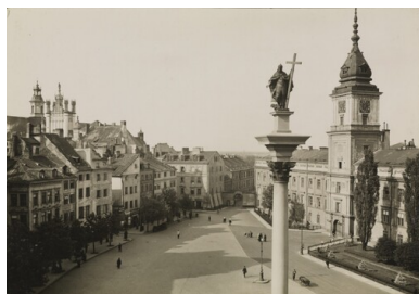
Warszawa, plac Zamkowy, przed 1939.