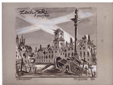
Rysunek ruin Zamku Królewskiego w Warszawie wykonany w 1941 r. przez L. Wiecheckiego w obozie w Tatiszewie w Związku Sowieckim pt. „Zaduszki Polskie” (awers).