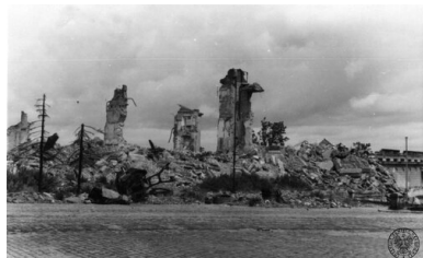
(Jeszcze do niedawna tu była) Warszawa, czerwiec 1945. Ruiny Zamku Królewskiego, widok od strony placu Zamkowego...