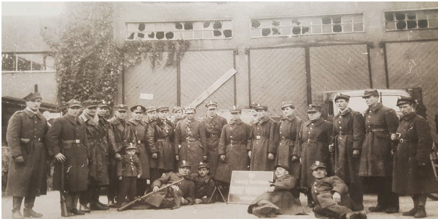
Warsztaty samochodowe MO, Gdańsk 1945, ze zbiorów Kuby Kowalskiego

https://przystanekhistoria.pl/pa2/tematy/aparat-bezpieczenstwa/81310,Milicja-Obywatelska-w-Gdansk-Formowanie-jednostek-i-ich-dzialalnosc-w-1945-roku.html