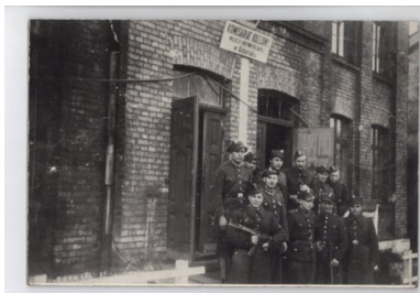
Komisariat Kolejowy MO w Gdańsku

Milicjanci pełnili również służbę na dworcach PKP, gdzie dbali o „ochronę pasażerów i ich mienia na terenie wszystkich pomieszczeń stacyjnych, tj. w budynkach i na peronach”. 20 sierpnia niejaki Kaatz zorganizował Komisariat Kolejowy MO w Gdańsku. We wrześniu utworzono posterunki kolejowe w Gdańsku-Wrzeszczu oraz na gdańskim dworcu głównym. Pomoc milicjantów ułatwiła służbę Straży Ochrony Kolei.