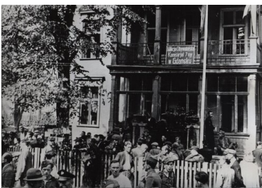
VII Komisariat MO w Gdańsku, 1945 r.

7 maja na terenie Dolnego Wrzeszcza urządzono milicyjną „wartownię”, czyli zapewne posterunek stanowiący filię VI Komisariatu MO (adres nieznany). Podlegał mu również posterunek stały MO Letniewo. Jeszcze w maju utworzono VIII Komisariat MO miasta Gdańska (Gdańsk-Sienna Huta, czyli Stogi) oraz IX Komisariat (Gdańsk-Brzeźno).