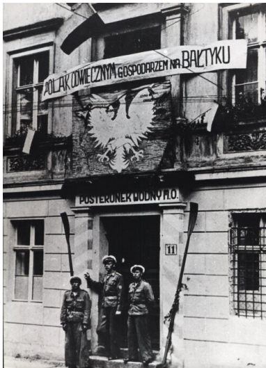
Posterunek Wodny MO w Gdańsku, 1945 r., ze zbiorów AIPN Gdańsk