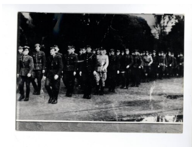
Wspólny marsz funkcjonariuszy MO i UB, Gdańsk 1945, ze zbiorów AIPN Gdańsk