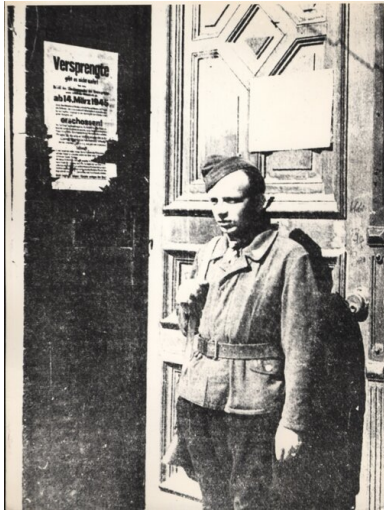
Milicjant na posterunku, Gdańsk 1945 r.