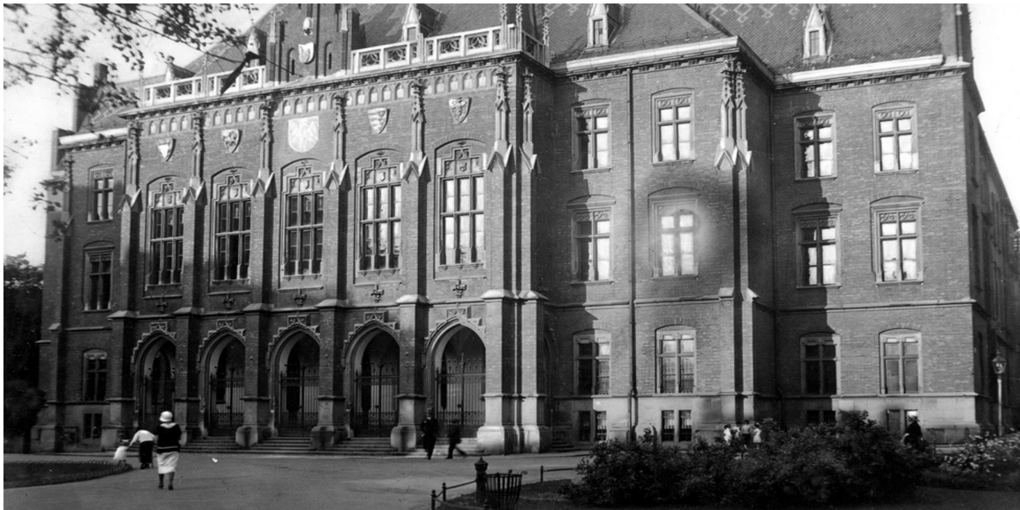
Collegium Novum Uniwersytetu Jagiellońskiego, 1927 r.

https://przystanekhistoria.pl/pa2/tematy/aparat-bezpieczenstwa/76495,Inwigilacja-i-proby-pozyskania-przez-bezpieke-prof-Konstantego-Grzybowskiego.html