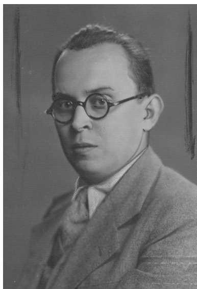
Konstanty Grzybowski - prawnik, profesor Uniwersytetu Jagiellońskiego. Fotografia portretowa.

Zalecono również przeprowadzenie wywiadu w miejscu zamieszkania oraz założenie podsłuchu telefonicznego oraz inwigilację korespondencji.